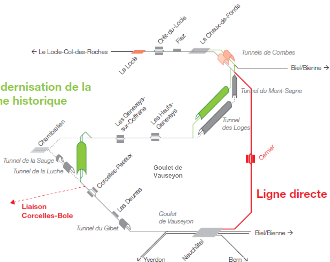
Figure 3 : Modernisation de la ligne historique ou nouvelle ligne directe

La législation fédérale permet le financement de la différence par le canton. Un préfinancement cantonal de 110 millions francs a été accepté à 84% lors de la votation cantonale du 28 février 2016 et montre la volonté politique et populaire de se doter de cette infrastructure.